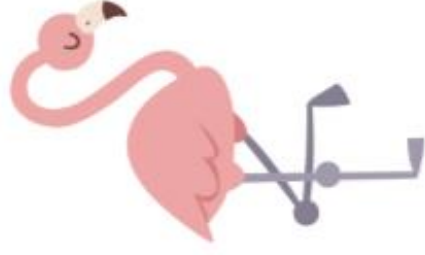
UN FLAMANT ROSE